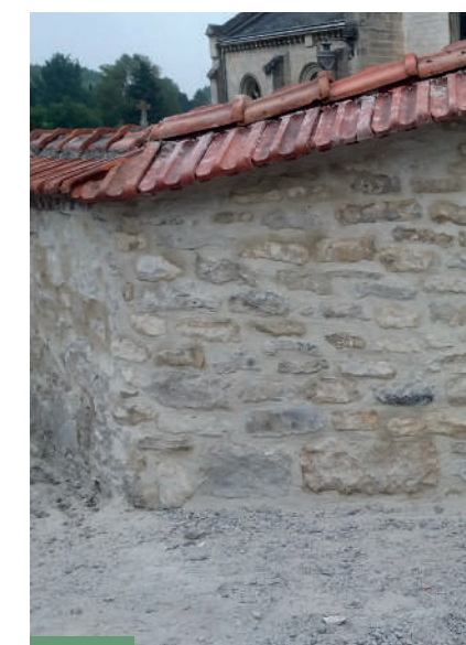
Réfection d'un mur de cimetière.

Travaux de réfection des murs intérieurs de l'église.