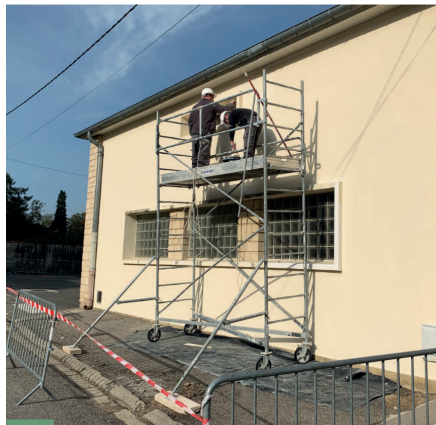
Salle des fêtes de Montaigu. Ravalement des façades.

Informations et inscriptions par mail : microcrechebellevue@free.fr