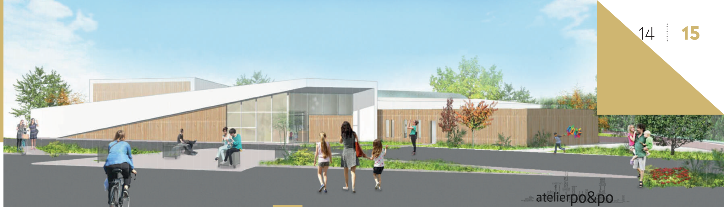
Projet architectural de la future piscine.