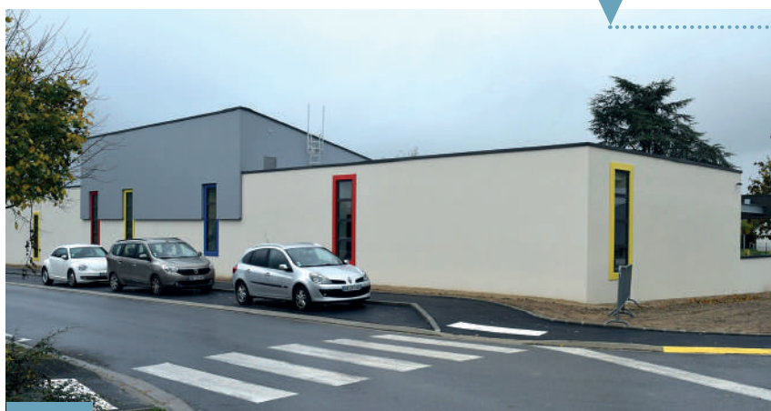
La nouvelle école Jacques Prévert

Afin de regrouper tous les élèves sur un seul site et de leur faire bénéficier d'un service optimal pour l'enseignement, la restauration et le transport, la commune a financé l'extension du groupe scolaire pour intégrer les classes élémentaires de l'école Prévert.