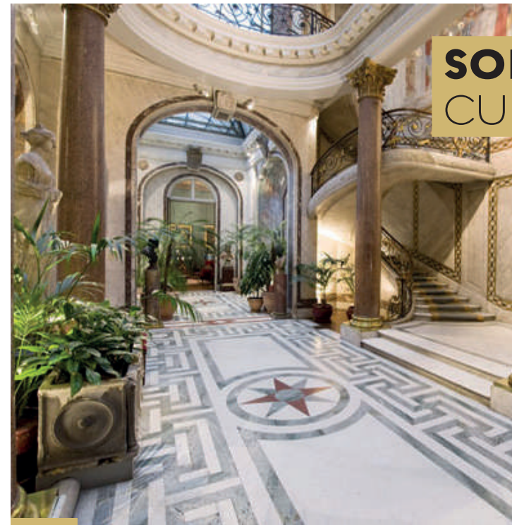
Musée Jacquemart : le jardin d'hiver et son ecalier monumental... construction féerique !

Mercredi 14h-16h30 → Condé-sur-Suippe Jeudi 9h30-12h30 → Pontavert | 13h30-16h30 → Roucy Vendredi 9h30-12h30 → Sissonne | 14h-16h30 → Berry-au-Bac