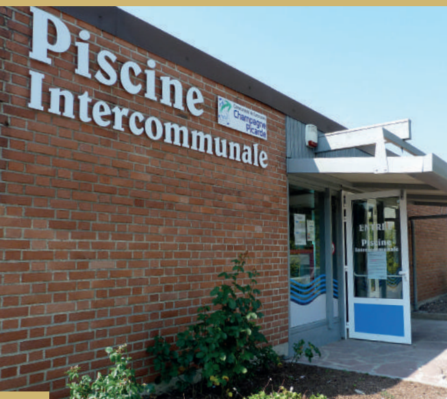
Piscine actuelle de Sissonne (entrée).