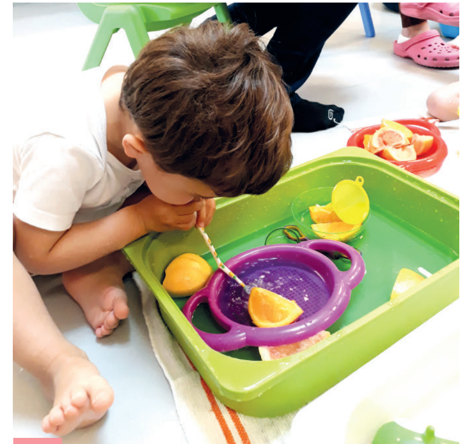
Activité d'éveil du relais Trottin-Trottine à Liesse-notre-Dame.

Ce lien qui se crée entre elles et l'enfant est formidable. Souvent, des années après, elles revoient encore des enfants qu'elles ont gardés.