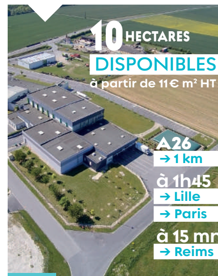
Pôle d'activité Champ Rolland à Villeneuve-sur-Aisne.

Au cœur de la Champagne Picarde, le pôle d'activité du Champ Rolland, situé à Villeneuve-sur-Aisne représente un bassin dynamique de 200 emplois.