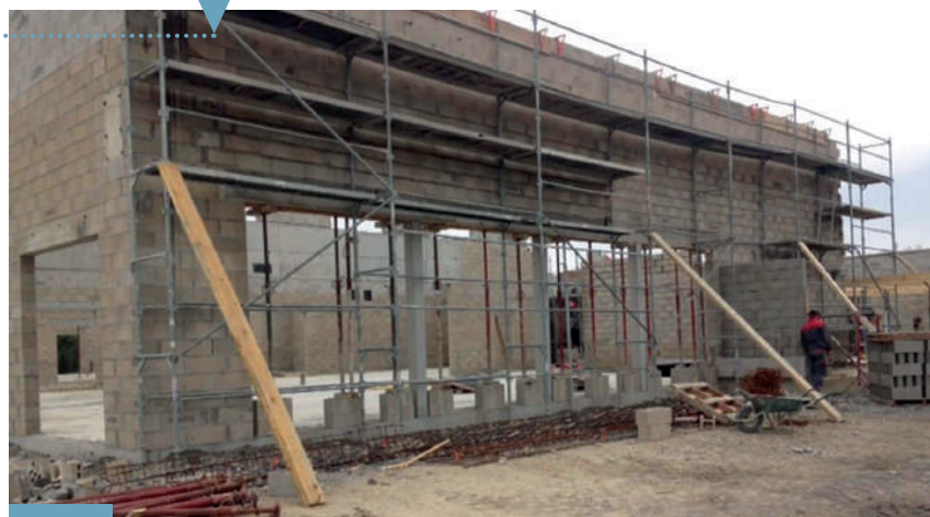
Les "1 ères pierres" du pôle scolaire.

Il comprendra 7 classes pour l'accueil des enfants, une cantine, des dortoirs et une salle de sports et d'activités. Ouverture en septembre 2020.