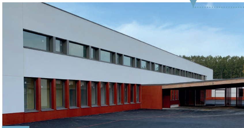
La cour et l'extension.