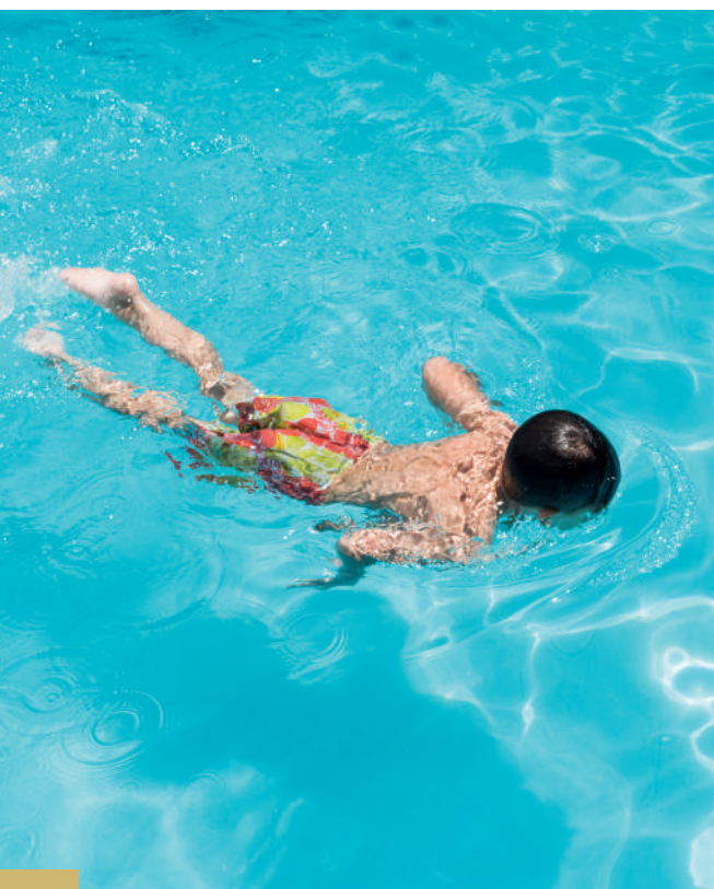
Un bassin idéal pour inciter les jeunes aux plaisirs de l'eau !